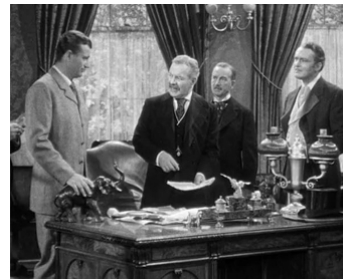
1943 LA RUÉE SANGLANTE (In Old Oklahoma) d'Albert S. Rogell avec J. Wayne, A. Dekker