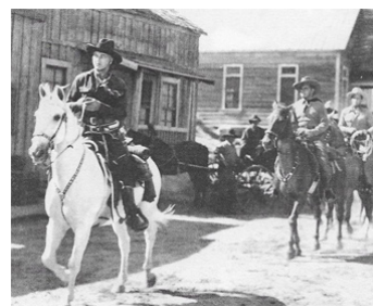
1936 CŒUR DE L'OUEST (Heart of the West) de Doris Schroeder avec William Boyd