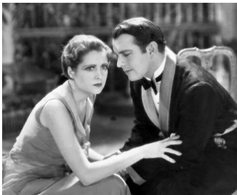
1931 THE LADY WHO DARED de William Beaudine avec Billy Dove