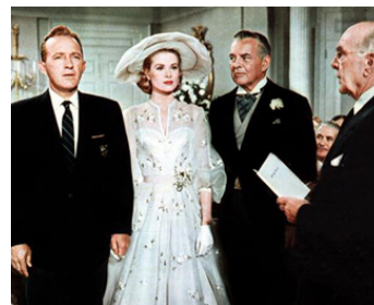
1956 HAUTE SOCIÉTÉ (High Society) de Charles Walters avec Bing Crosby, Grace Kelly