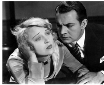
1929 THE LOVE RACKET de William A. Seiter avec Dorothy McKaill