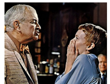
1968 LE BÉBÉ DE ROSEMARY (Rosemary's Baby) de Roman Polanski avec Mia Farrow