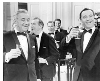
1965 COMMENT TUER SA FEMME (How to murder your Wife) de Richard Quine avec Jack Lemmon