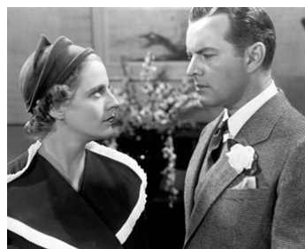
1935 GREAT GOD GOLD d'Arthur Lubin avec Martha Sleeper