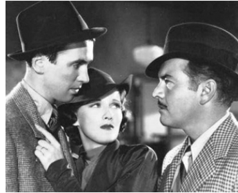
1937 LE DERNIER GANGSTER (The last Gangster) d'E. Ludwig avec J. Stewart, Rose Stradner