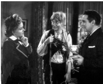
1941 CHEERS FOR MISS BISHOP de Tay Garnett avec Martha Scott, Sterling Holloway