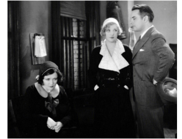
1931 IT'S A WISE CHILD de Robert Z. Leonard avec Marie Prevost, Marion Davies