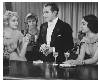
1935 SMART GIRL d'Aubrey Scotto avec Ida Lupino, Gail Patrick