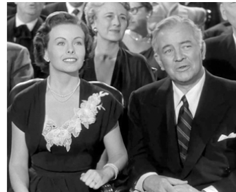
1951 ON MURMURE DANS LA VILLE (People will talk) de J. Mankiewicz avec Jeanne Crain