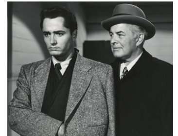
1951 LE HÉROS DU SAMEDI (Saturday's Hero) de David Miller avec John Derek