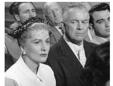
1956 L'INVRAISEMBLABLE VÉRITÉ (Beyond a Reasonable Doubt) de F. Lang avec J. Fontaine