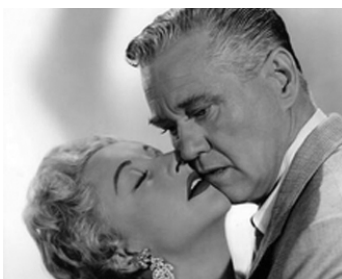
1956 ACCUSÉE DE MEURTRE (Accused of Murder) de Joseph Kane avec Vera Ralson