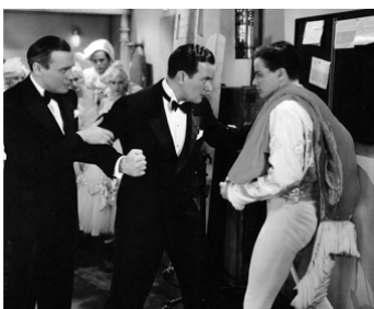
1934 TRANSATLANTIC MERRY-GO-ROUND de Benjamin Stoloff avec J. Benny, C. Moore Jr