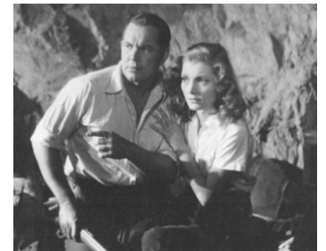
1933 LE DÉLUGE (The Deluge) de Felix E. Feist avec Peggy Shannon