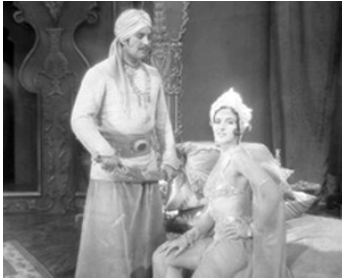
1930 KISMET (Kismet) de John Francis Dillon avec Mary Duncan