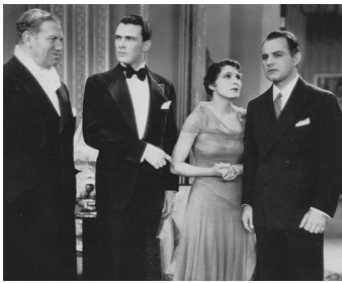
1929 A MOST IMMORTAL LADY de John Griffith Wray avec M. Love, W. Pidgeon, Leatrice Joy