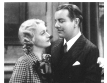
1935 THE GIRL WHO CAME BACK de Charles Lamont avec Shirley Grey