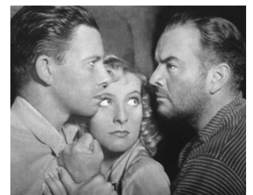
1936 SÉQUESTRÉE ! (Woman Trap) d'Harold Young avec George Murphy, Gertrude Michael