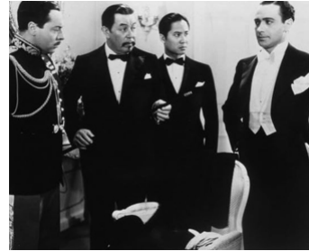
1937 CHARLIE CHAN AT MONTE CARLO d'E. Forde avec H. Huber, W. Oland, K. Luke