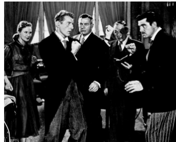
1948 SI BÉMOL ET FA DIÈSE (A Song is Born) d'H. Hawks avec V. Mayo, D. Kaye, S. Cochran