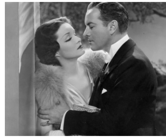
1937 DEUX FEMMES (John Meade's Woman) de Richard Wallace avec Gail Patrick