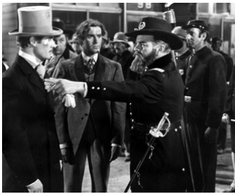
1937 L'INCENDIE DE CHICAGO (In Old Chicago) d'Henry King avec Don Ameche, Tyrone Power