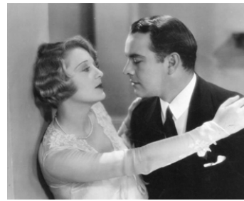
1930 STRICTLY MODERN de William A. Seiter avec Dorothy McKaill