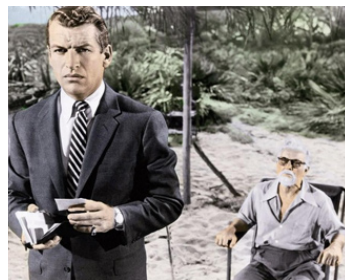
1955 LE TRAIN DU DERNIER RETOUR (The View from Pompey's Head) de Ph. Dunne avec R. Egan