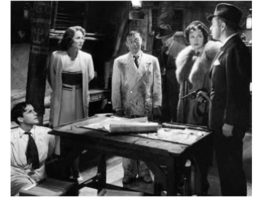
1937 LE SERMENT DE M. MOTO (Thank you, Mr Moto) de N. Foster avec Peter Lorre