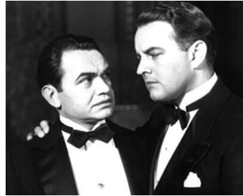
1931 LE PETIT CÉSAR (Little Caesar) de Mervyn LeRoy avec Edward G. Robinson