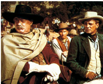
1946 DUEL AU SOLEIL (Duel in the Sun) de King Vidor avec Joseph Cotten