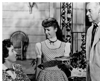
1957 TAMMY AND THE BACHELOR de Joseph Pevney avec Mala Powers, Debbie Reynolds