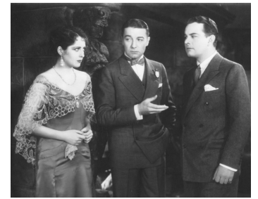
1930 SWEETHEARTS AND WIVES de Clarence G. Badger avec Billie Dove, Clive Brook