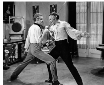
1934 THE COUNT OF MONTE-CRISTO de Rowland V. Lee avec Robert Donat