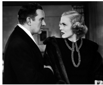
1937 GIRL OVERBOARD de Sidney Salkow avec Gloria Stuart