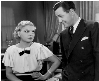
1933 GOODBYE LOVE d'H. Bruce Humberstone avec Mayo Methot