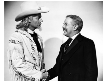
1944 BUFFALO BILL (Buffalo Bill) de William A. Wellman avec Joel McCrea