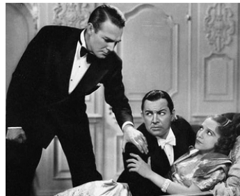
1933 COCKTAIL HOUR de Victor Schertzinger avec Randolph Scott, Bebe Daniels