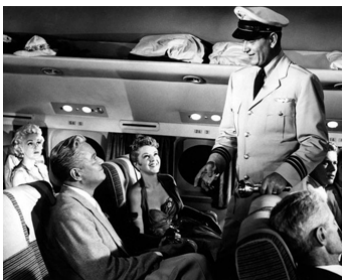
1954 ÉCRIT DANS LE CIEL (The High and the Mighty) de William A. Wellman avec J. Wayne